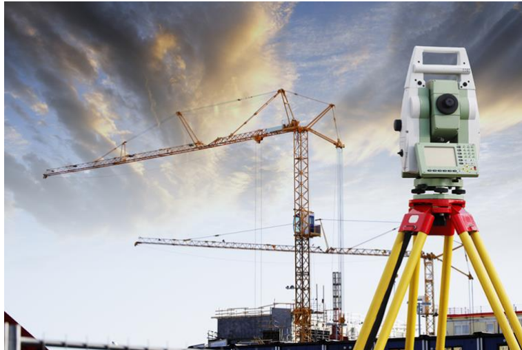
Okulumuzdaki Elektronik ölçü aletlerinden birinin görünümü