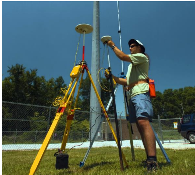
Okulumuzda bulunan son teknoloji ölçü aletleri (GPS) nin görünümü